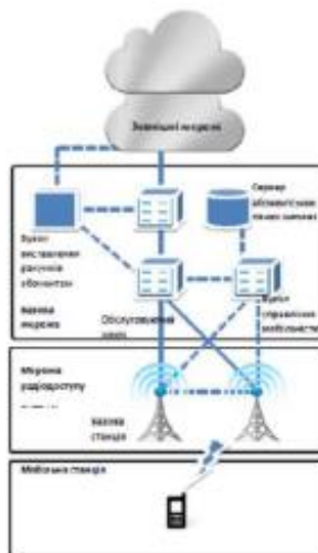
Рисунок 4.1 – Структурна схема мережі LTE

Усі ілюстрації називаються рисунками, їх обов'язково нумерують за розділами та надають назву (наприклад: рис. 1.1 – Структурна схема системи передачі). Підпис не може відриватись від самого рисунка (розміщуватись на іншій сторінці). Номер та назва розміщуються внизу.