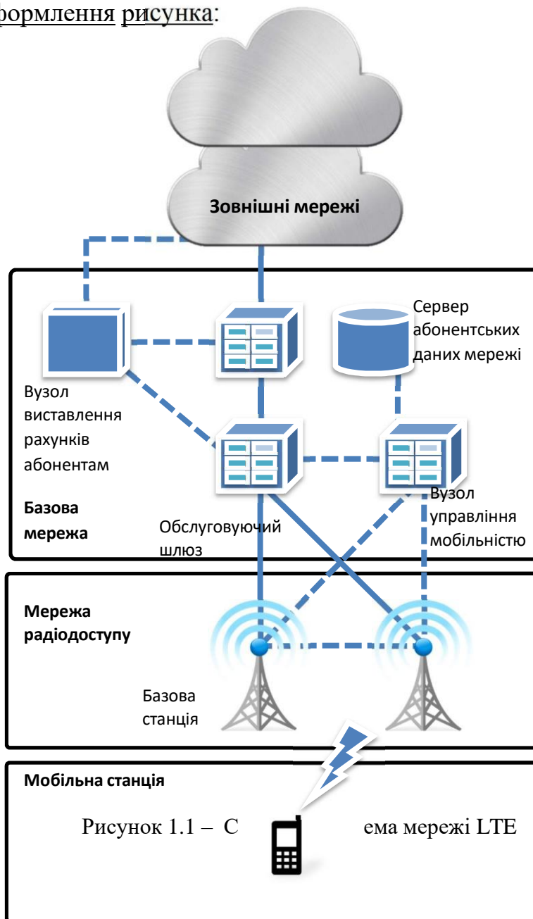
Рисунок 1.3 – Структурна схема мережі LTE