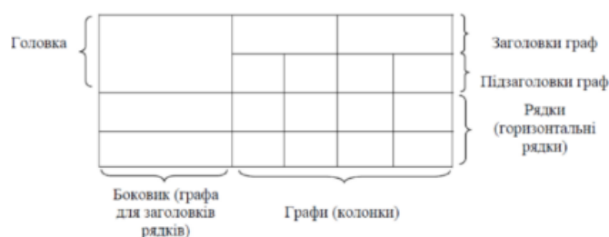
Рис. 1.5 – Структура таблиці

На всі таблиці мають бути посилання в тексті кваліфікаційної роботи. Таблиці слід нумерувати арабськими цифрами порядковою нумерацією в межах розділу, за винятком таблиць, що наводяться у додатках. Номер таблиці складається з номера розділу і порядкового номера таблиці, відокремлених крапкою, наприклад, таблиця 2.1 – перша таблиця другого розділу.