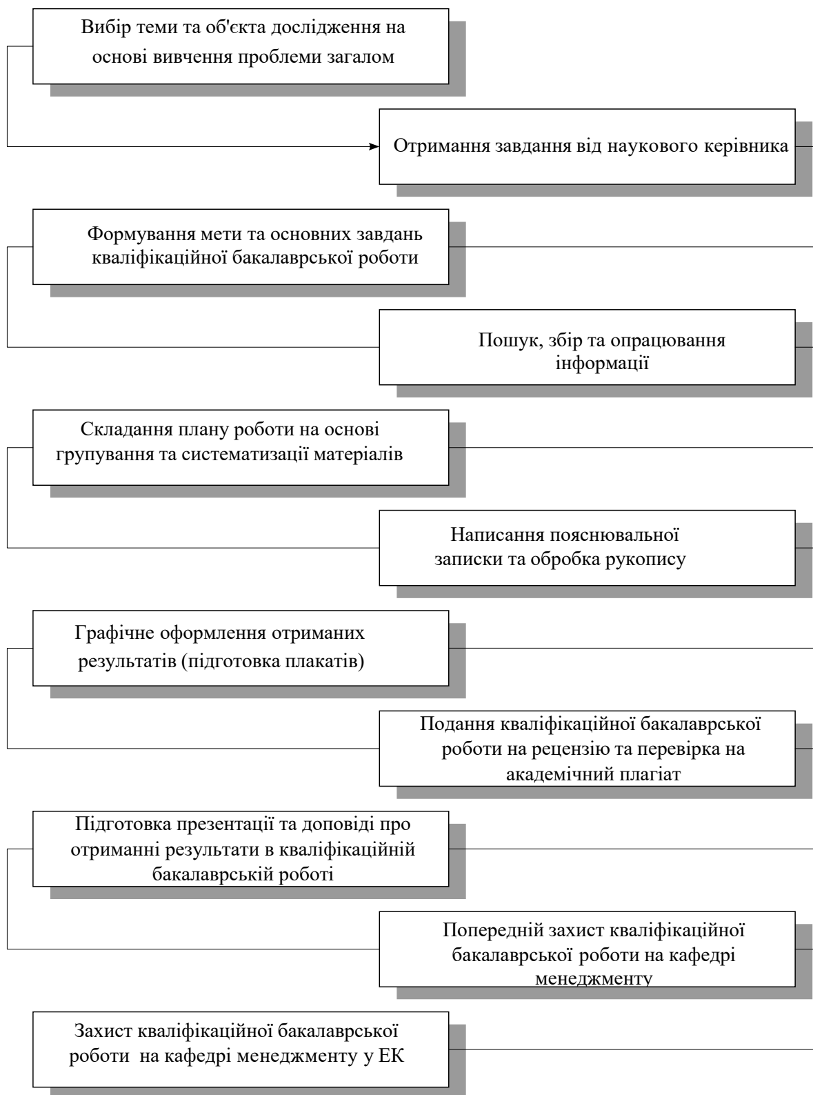
Рис. 1. Перелік і послідовність основних етапів виконання і захисту КБР

Перелік і послідовність основних етапів виконання і захисту КБР наведено на рисунку 1.