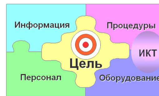
Рис. 1. Основные компоненты информационной системы

Информационная система в таком контексте должна рассматриваться как среда, обеспечивающая целенаправленную деятельность организации. Т.е. она представляет собой совокупность таких компонентов как информация, процедуры, персонал, аппаратное и программное обеспечение, объединенных регулирующими взаимоотношениями для формирования организации как единого целого и обеспечения её целенаправленной деятельности (рис. 1).