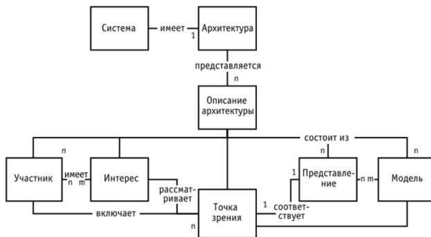
Рис. 2. Рамочная модель разработки архитектуры по IEEE 1471

В соответствии с этим представлением система обладает архитектурой, которая может быть описана с различных точек зрения заинтересованных лиц, рассматривающих архитектуру системы. Каждой точке зрения на архитектуру системы соответствует определенное представление, основу которого составляет набор моделей. Однако этот стандарт не определяет структуру собственно архитектуры предприятия. Например, говорится о том, что необходимо иметь различные представления архитектуры, но при этом не указывается, какие это должны быть представления.