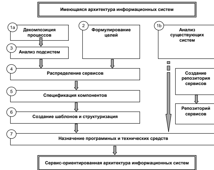
Рис. 4. Схема процесса преобразования имеющейся архитектуры информационной системы в сервис-ориентированную архитектуру.

Процесс преобразования существующей архитектуры информационных систем в сервис-ориентированную архитектуру состоит из семи шагов и представлен схемой на рисунке 4.