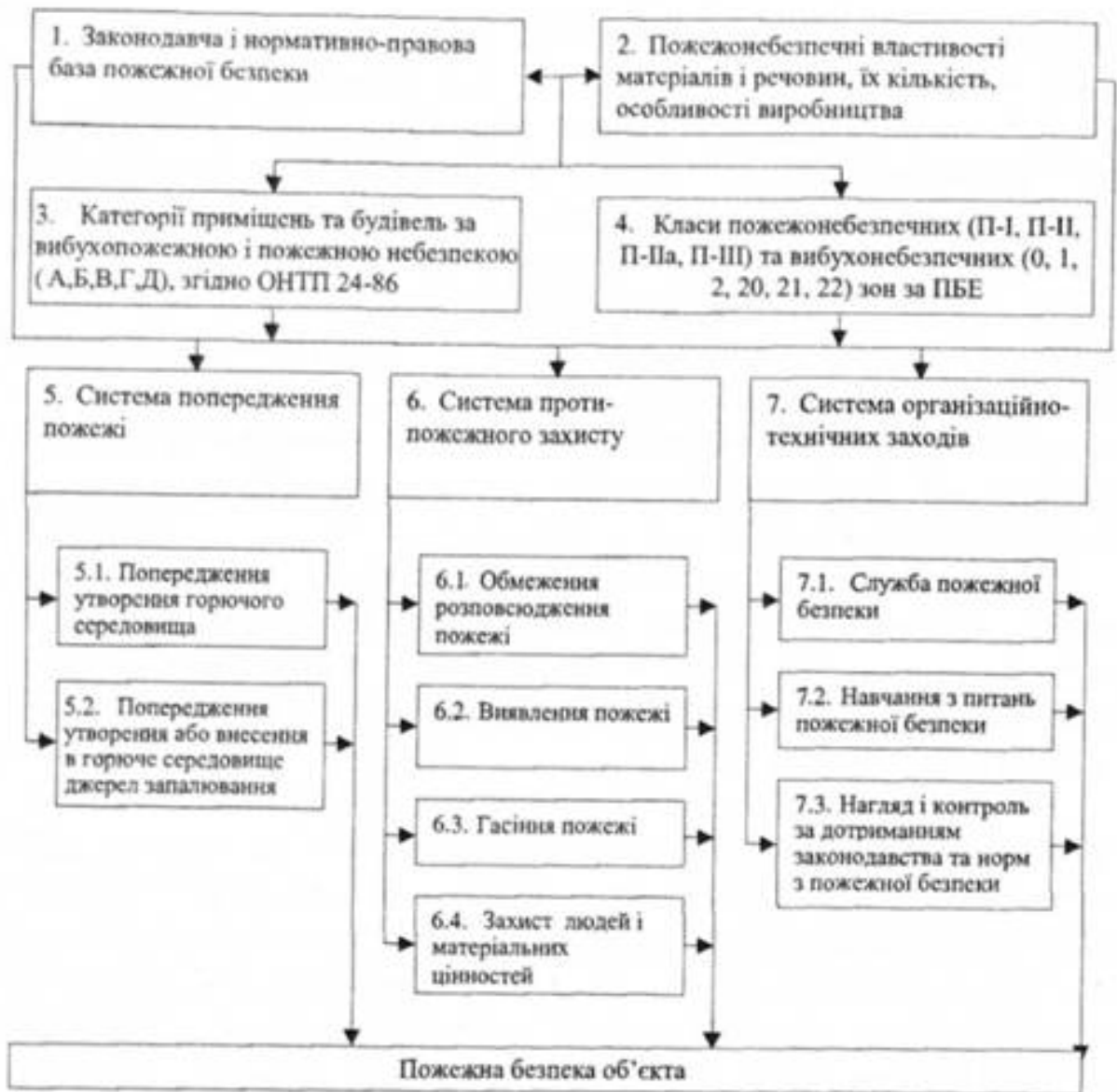
Рис. 10.1 Забезпечення пожежної безпеки об'єкта