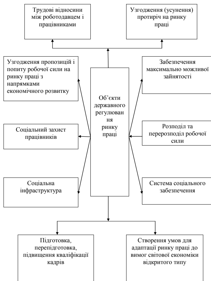
Рис. 2. Об'єкти державного регулювання ринку праці

Під принципами управління розуміють керівні правила, основні положення, норми поведінки, що відображають найбільш стійкі риси законів і закономірностей управління, яких необхідно дотримуватися в управлінській діяльності.