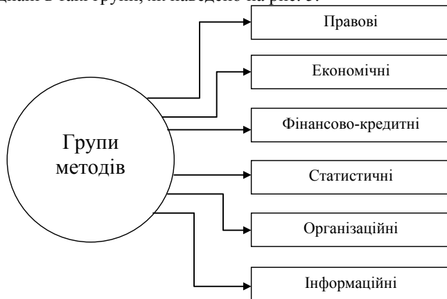
Рис. 5. Основні групи методів, які використовуються в державному регулюванні ринку праці.

Державне регулювання ринку праці передбачає використання всього спектру сукупності як традиційних, так і специфічних методів, прийомів, засобів. У загальному вигляді, враховуючи особливості і специфіку методів для розробки, прийняття і реалізації регуляторних дій держави в сфері ринку праці, вони об'єднані в такі групи, як наведено на рис. 5.