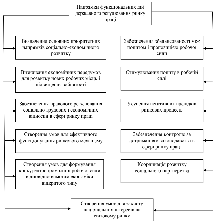
Рис. 3. Напрямок функціональних дій державного регулювання ринку праці

Виходячи з наведених завдань, основні напрямки функціональних дій їх виконання в межах повноважень державних органів влади можна представити у вигляді схеми (рис. 3).