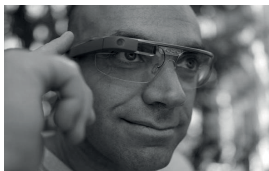
Рис. 7. Загальний вигляд розумних окулярів Google Glass

Такі розумні окуляри оснащені двома застосунками. Перший – дає змогу швидко робити та завантажувати фотографії з місця події. Другий – сканує номер автомобіля й визначає власника.