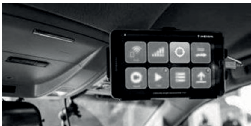
Рис. 2. Відеореєстратор Rocket IoT

Нагрудні камери для поліцейських “BodyWorn” паралельно з'єднуються з відеореєстратором для патрульних автомобілів Rocket IoT (рис. 2) [8]. Пристрої діють синхронно та автономно.