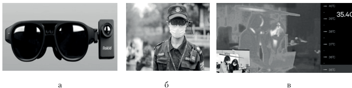
Рис. 8. Загальний вигляд розумних окулярів T1 (а, б) та принцип їх дії (в)

Для виконання подібних завдань китайська поліція, медперсонал та співробітники транспортних служб почали використовувати розумні шоломи для пошуку людей із підвищеною температурою. Шоломи виготовлені китайською фірмою KC Wearable (рис. 9) [19], використовують тепловізор для вимірювання температури людей на відстані близько трьох метрів.