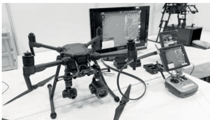
Рис. 11. Загальний вигляд дрона (робота-поліцейського) (Японія)

Подібні роботи-поліцейські (дрони) почали працювати в аеропорті міста Наріта в Японії. Зовнішній вигляд електронних правоохоронців наведено на рис. 11 [24]. Такі роботи здатні миттєво аналізувати зображення, отримане із встановлених камер. Вони мають динаміки, тому можуть закликати пасажирів дотримуватися порядку. Також передбачається, що ці дрони стежитимуть за безпекою, а також шукатимуть забуті речі або виявлятимуть підозрілі предмети.