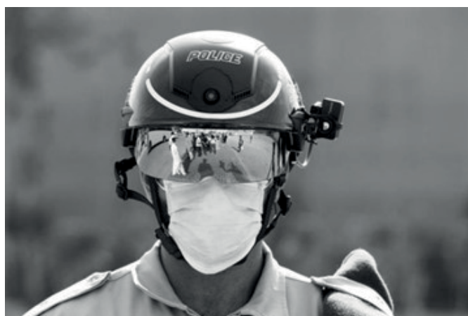
Рис. 9. Загальний вигляд розумного шолому KC N901 фірми KC Wearable (Китай)

Співробітник правоохоронних органів у шоломі може виконувати такі дії: вимірювати температуру конкретної людини, вимірювати температуру декількох людей, що проходять повз скупчення людей, розпізнавати номерні знаки, а також помічати людей у темряві.