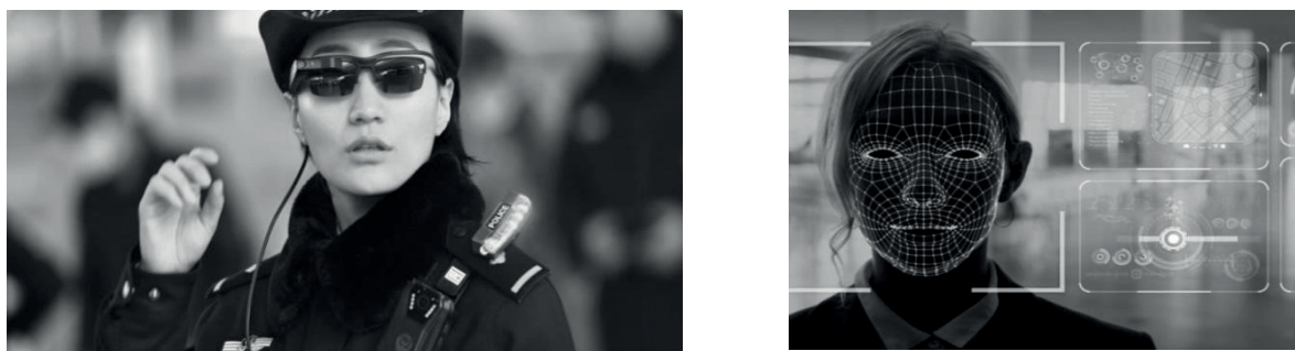
Рис. 6. Загальний вигляд “розумних” сонцезахисних окулярів і принцип ідентифікування обличчя людини

Останнім часом правоохоронні служби світу для виконання своїх обов’язків почали широко застосовувати “розумні” окуляри. У Китаї поліція використовує “розумні” сонцезахисні окуляри для виявлення злочинців у місцях масового скупчення людей (вокзали, аеропорти тощо) (рис. 6) [15].