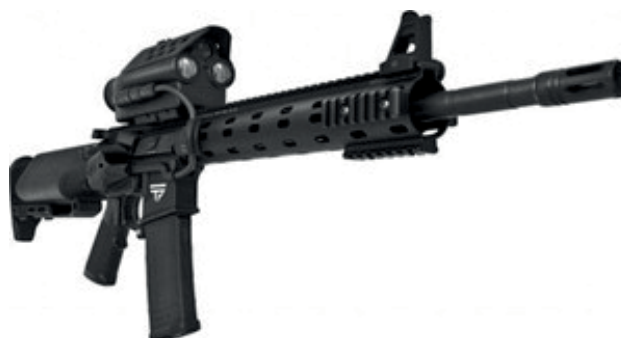
Рис. 5. Загальний вигляд “розумної” гвинтівки фірми Tracking Point (США)

Останнім часом у США тестують нові модифікації “розумної” гвинтівки компанії Tracking Point, яка дозволить покращити точність пострілу (рис. 5) [14].