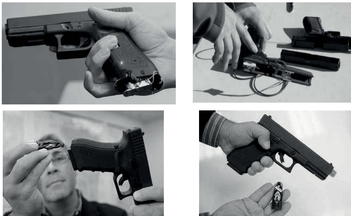
Рис. 3. Розумний пістолет компанії Yardarm

У Каліфорнійській компанії Yardarm зараз працюють над покращанням стрілецької зброї для патрульних. Спеціальний датчик, що встановлюється на пістолет (рис. 3) [10], може відстежувати їх місцезнаходження, визначати, чи знаходиться пістолет у кобурі, чи ні, а також визначати час, коли пістолет був заряджений і коли з нього був здійснений постріл.