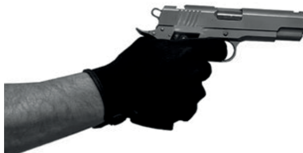
Рис. 4. Розумний пістолет компанії LodeStar Works (калібр 9-мм)

Над подібними проектами з розроблення розумних пістолетів також працюють американські компанії LodeStar Works і SmartGunz LLC [12]. У середині січня 2022 року LodeStar Works і SmartGunz розробили різні розумні пістолети, які здатні впізнавати свого власника (рис. 4) [13].