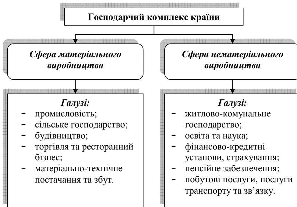
Рисунок 7.1 – Сфери і галузі виробництва господарського комплексу країни

Об'єктом вивчення макроекономіки виступає національна економіка країни – це господарський комплекс, який являє собою сукупність взаємозалежних галузей, що відрізняють її національне господарство від господарств інших країн. Господарський комплекс поділяють на матеріальне і нематеріальне виробництво (рис. 7.1).