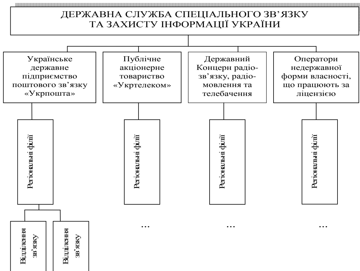
Рисунок 8.1. Структура управління в галузі зв'язку

3. Дивізіональна структура являє собою «скоординовану децентралізацію». Підрозділи-дивізіони (стратегічні бізнеси-підрозділи) мають значну виробничо-господарську самостійність за відсутності статусу юридичних осіб.