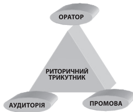
Рис. 1. Риторичний трикутник 2

У риторичі це називається «риторичним трикутником» (рис. 1).