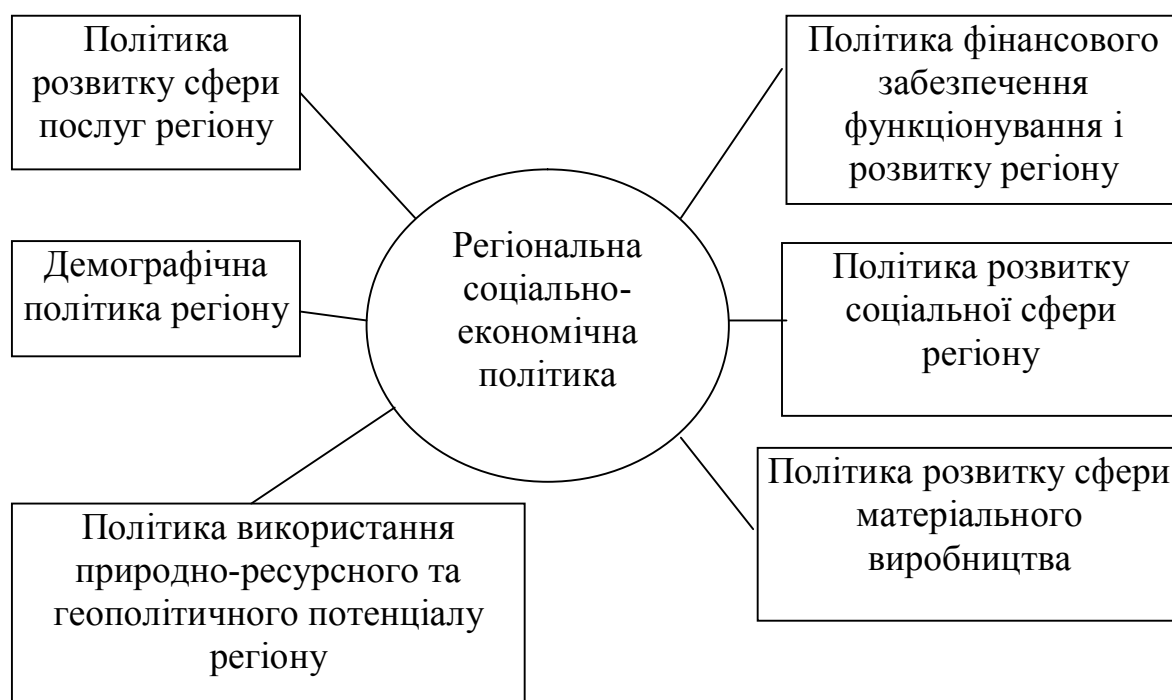
Рисунок 5.1. Основні складові політики соціально-економічного розвитку регіону

З метою комплексного вирішення проблем Одещини облдержадміністрацію були визначені основні напрямки регіонального розвитку, які містяться у програмі "Регіональна ініціатива".