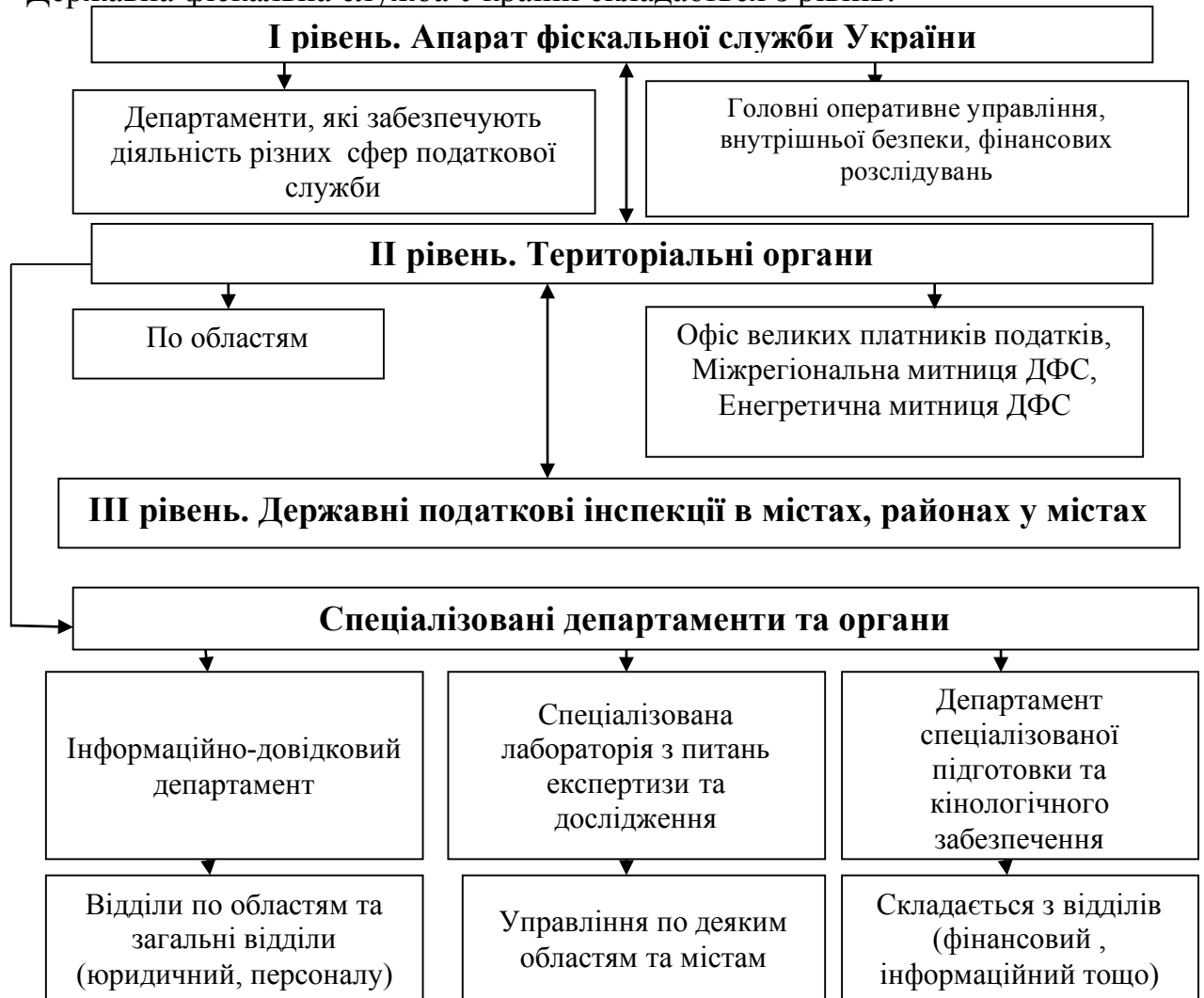
Рисунок 1 - Структура Державної фіскальної служби України

Державна фіскальна служба України складається з рівнів.