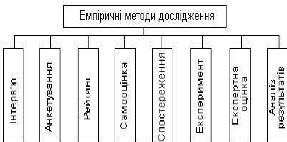
Рис. 1.5. Емпіричні методи наукового дослідження

Отримана за допомогою емпіричних методів наукового дослідження інформація є основою для подальшого теоретичного осмислення пізнавальних процесів. Складові емпіричних методів дослідження зображені на рис. 1.5.