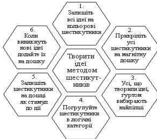
Рис. 4.1. Моделювання ідей за допомогою шестикутників

На університетських студіях мислення вивчають у рамках логіки, філософії, психології, інформатики, моделювання.