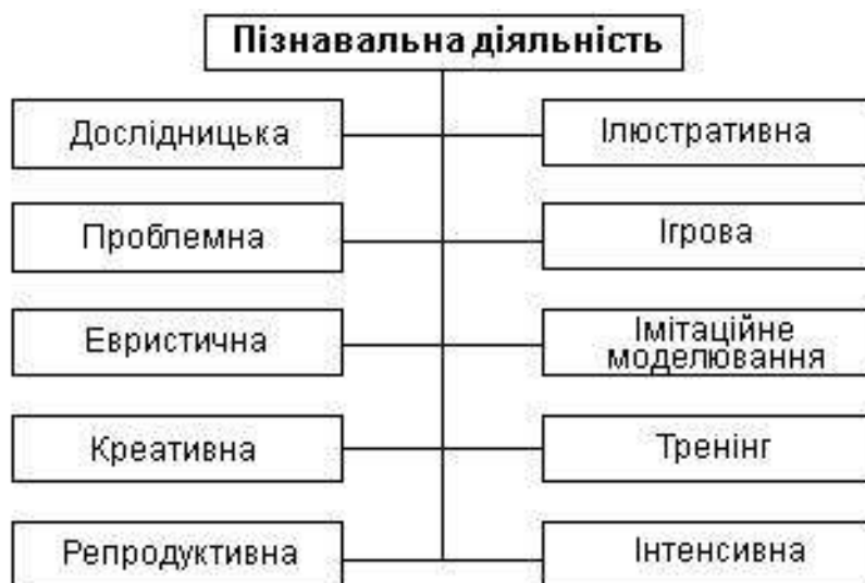
Рис.1.1. Схема пізнавальної діяльності

До методів першої класифікаційної групи ( характер пізнавальної діяльності ) здебільшого відносять дослідницькі, проблемні, евристичні, креативні, репродуктивні, ілюстративні, ігрові, імітаційного моделювання, тренінгу тощо. Зобразимо їх у вигляді структурної схеми (див. рис. 1.1).