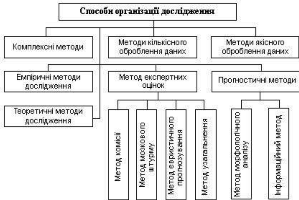
Рис.1.2. Способи організації наукового дослідження

Комплексні методи дослідження, які дають змогу розкрити структурно-функціональні зв'язки складного цілісного об'єкта.