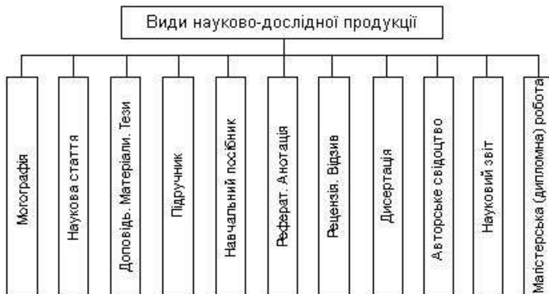
Рис.3.1. Форми викладу матеріалу наукового дослідження

Існують різні форми викладу матеріалу наукового дослідження (див. рис. 3.1).