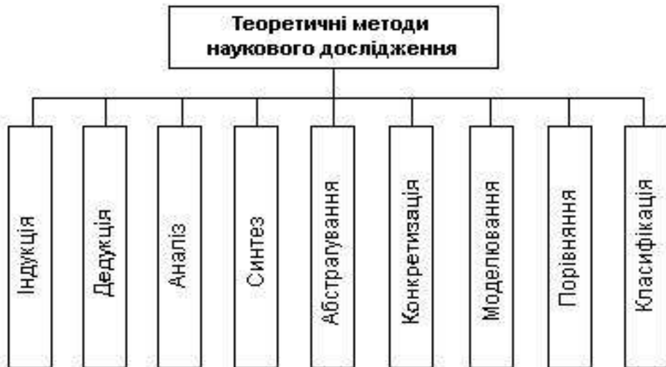
Рис. 1.4. Категорії теоретичних методів наукового дослідження

До теоретичних методів наукового дослідження зазвичай відносять категорії, які наведено на рис. 1.4.