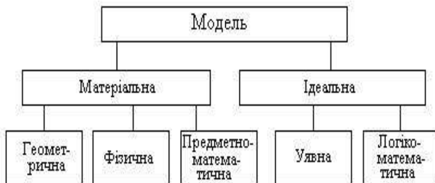
Рис. 2.1. Схема класифікації моделей

Під класифікацією моделей розуміють їх поділ на види, групи, класи на підставі певних ознак (наприклад, функціональних можливостей, повноти охоплення предметної області, точності відображення об'єкта управління тощо), хоча чіткої межі між окремими ознаками не існує. Головні відмінні риси, притаманні різним моделям, можна простежити за класифікаційною схемою, що наведена на рис. 2.1.