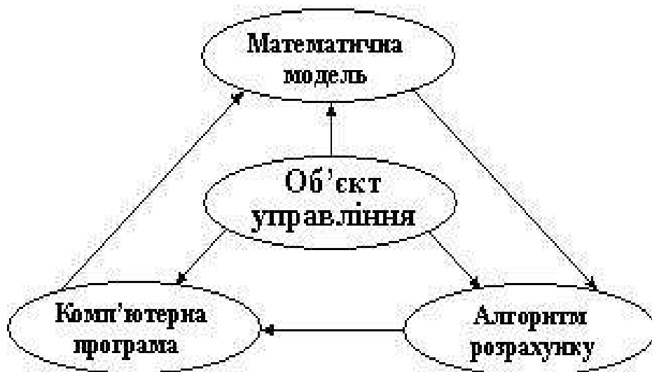
Рис. 2.2. Етапи математичного моделювання

На першому етапі будують або вибирають “еквівалент” об’єкта управління, який у математичній формі відображає найважливіші (ключові) його властивості – закони і закономірності, яким він підпорядковується, структурні та інформаційні зв’язки складових частин об’єкта управління і т.д.