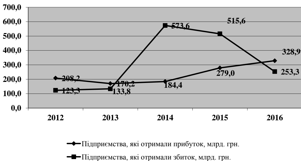
Рис. 1. Фінансові результати до оподаткування великих та середніх підприємств України за 2012-2016 рр.

Відповідно до підсумків Державної служби статистики України, у 2016 р. фінансовий результат до оподаткування великих та середніх підприємств становив 75,6 млрд. грн. прибутку проти 236,6 млрд. грн. збитків у 2015 р. та 389,2 млрд. грн. у 2014 р. (рис.1).