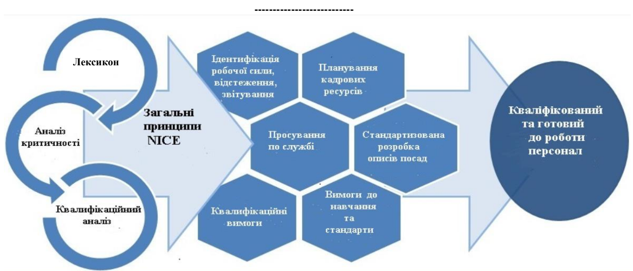
Рисунок 2. Складові елементи для здатного та готового персоналу у сфері кібербезпеки

На Рисунку 2 показано, що Загальні принципи NICE є центральною ланкою між роботодавцями та кваліфікованим і готовим до роботи персоналом у сфері кібербезпеки.