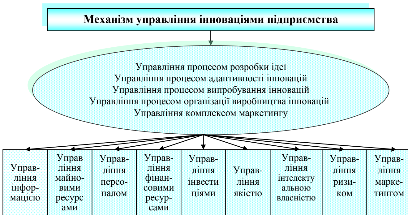
Рис. 5.1. Структура механізму управління інноваціями підприємства

Враховуючи особливості процесу управління інноваціями можна виділити наступні функціональні елементи механізму управління інноваціями на підприємстві, що представлено на рис. 5.1.