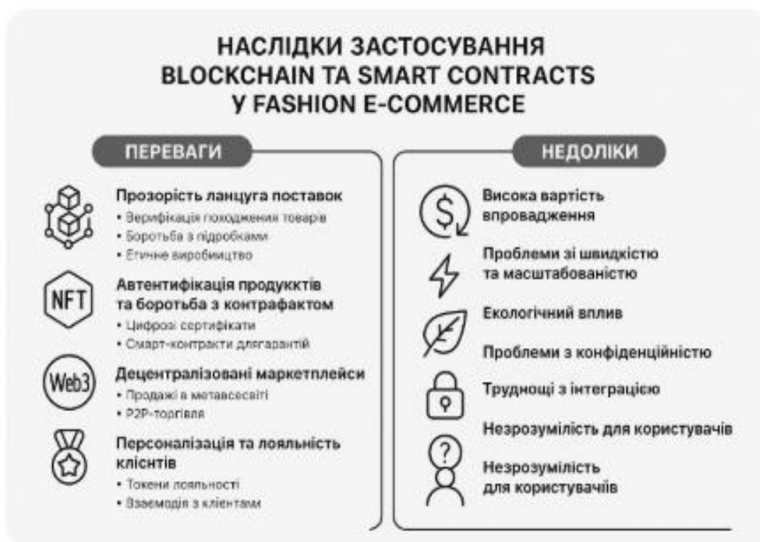
Рисунок 1.4 – Наслідки застосування Blockchain та Smart Contracts у Fashion E-commerce: переваги та недоліки [14]

Блокчейн та смарт-контракти відкривають нові можливості для підвищення прозорості ланцюгів постачання, боротьби з контрафактною продукцією та створення нових форм взаємодії з клієнтами у Fashion E-commerce. Схематично подано основні переваги й недоліки застосування Blockchain та Smart Contracts у модній електронній комерції уа рис. 1.4