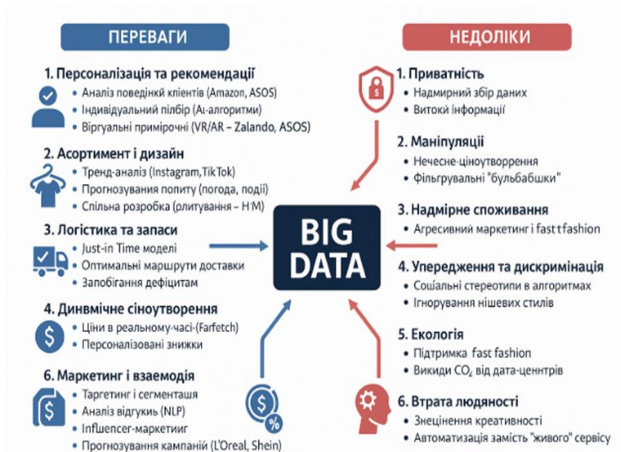
Рисунок 1.2 – Вплив Big Data у Fashion E-commerce: переваги та недоліки [12]

Технології Big Data у Fashion E-commerce дозволяють системно збирати та аналізувати великі масиви даних про поведінку користувачів, продажі, логістику та ринкові тренди. Подано узагальнену схему впливу Big Data на модну електронну комерцію з погляду їхніх переваг та недоліків на рис. 1.2