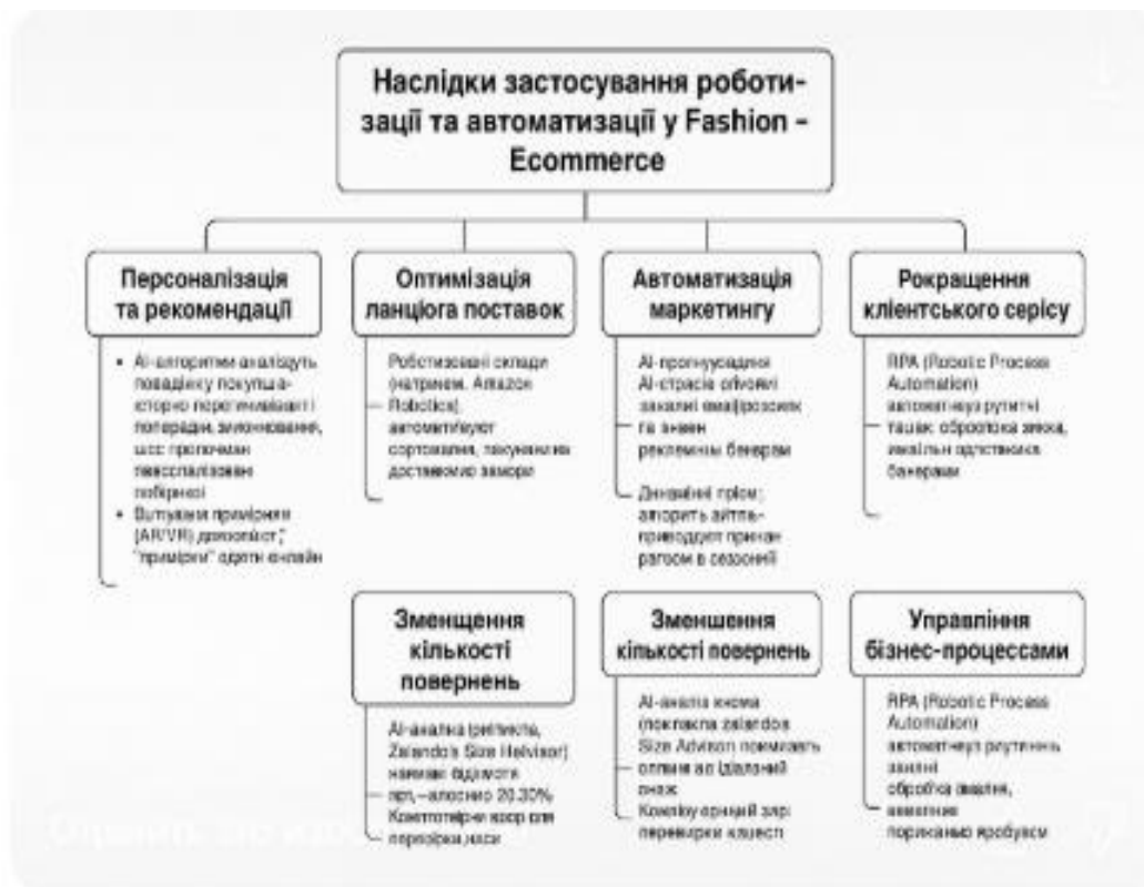
Рисунок 1.5 – Наслідки застосування роботизації та автоматизації у Fashion E-commerce: переваги та недоліки [15]

Роботизація й автоматизація процесів у Fashion E-commerce охоплюють роботизовані склади, автоматизовані системи сортування й пакування, використання мобільних роботів, чат-ботів, систем RPA для оброблення транзакцій та управління даними. Наведено узагальнення впливу роботизації та автоматизації на модну електронну комерцію на рис. 1.5.