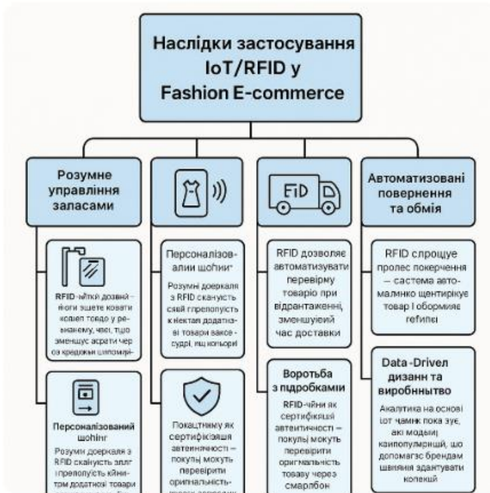
Рисунок 1.3 – Наслідки застосування IoT/RFID у Fashion E-commerce: переваги та недоліки [13]

IoT та RFID-технології у Fashion E-commerce забезпечують підвищення прозорості та керованості фізичних потоків товарів. Відображено основні наслідки застосування IoT/RFID для модної електронної комерції на рис. 1.3