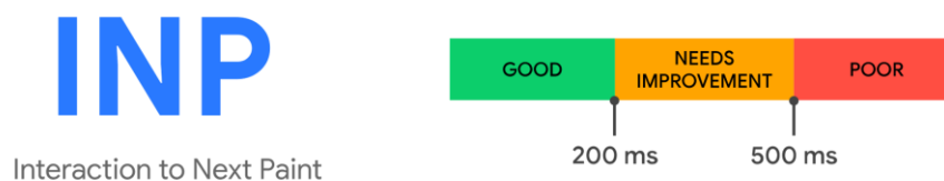
Рисунок 2.1 - Пороги Interaction to Next Paint (INP): «добре» \leq 200 мс; «погано» > 500 мс [18]

Ключовою метрикою якості взаємодії у 2025 році є Interaction to Next Paint (INP), яка характеризує загальну чутливість інтерфейсу до дій користувача, включаючи затримки в обробленні подій і відмальовуванні наступного кадру. Методичні рекомендації пропонують орієнтуватися на INP не вище 200 мс (на 75-му перцентилі сесій) як «добрий» рівень, тоді як значення понад 500 мс розглядаються як «погані» [18]. Для модних каталогів із великою кількістю зображень високої якості це безпосередньо означає пріоритет серверного рендерингу та потокової видачі HTML, мінімізацію клієнтських пакетів JavaScript, винесення «важких» обчислень у веб-воркери або бекенд-сервіси, а також застосування адаптивних стратегій завантаження медіа залежно від умов мережі [18]. Наочні пороги INP відображено на діаграмі (рис. 2.1).